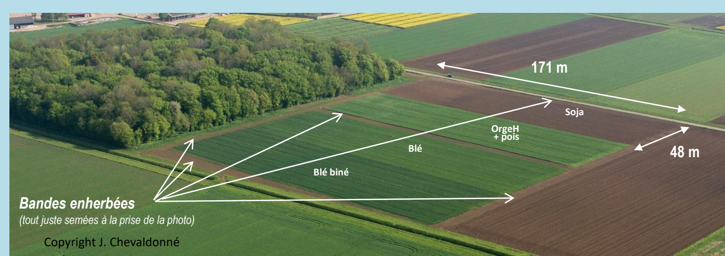
Dispositif de Bretenière : assolement 2012-2013